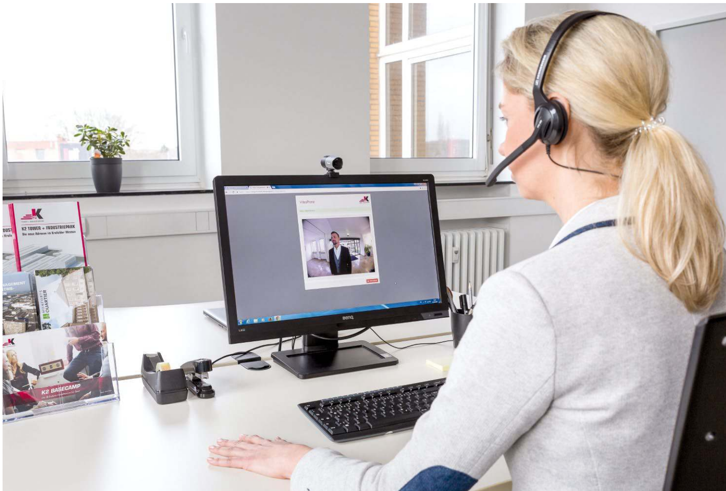
Die offizielle Anmeldung via Videokommunikation vermeidet unbefugte, unkontrollierte Gebäudezutritte.

Die Videokommunikation kann zentral über einen Empfang oder auch dezentral über die einzelnen Mieter erfolgen. Jeder Mieter der über ein Laptop und Telefon verfügt ist in der Lage eingehende Anrufe entgegenzunehmen. Zur Übertragung des Videostreams wird ein Backoffice Arbeitsplatz mit einer Web-Kamera und einem Headset ausgerüstet. Die Videokommunikation erfolgt über das Internet. Sie ist netzübergreifend, daher ist kein gemeinsames Netzwerk oder Kabelverbindung notwendig.