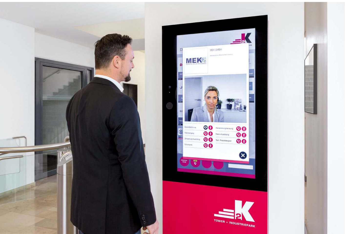
Mittels bidirektionaler Videoübertragung wird eine persönliche Kontaktaufnahme hergestellt und ein individueller Besucherservice geboten.

Die Kontaktaufnahme kann wahlweise per Anruf nur über Audio auf das Festnetz, oder per Videostream über ein eigenes webbasiertes Softphone erfolgen. In beiden Fällen ist es nicht erforderlich zusätzliche Software beim Mieter zu installieren.