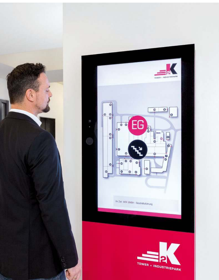
Die digitale Wegeleitung überzeugt durch animierte, lagerichtige Grundrisspläne, eine anschauliche Ebenenanzeige und eine detaillierte Zoomdarstellung der Wegstrecke.

Über den Funktionsbutton „Wegeleitung“ kann sich der Besuch den kürzesten Weg in Form einer dynamischen, animierten Wegeleitung anzeigen lassen. Möglich ist darüberhinaus auch die Darstellung einer barrierefreien Wegeführung.